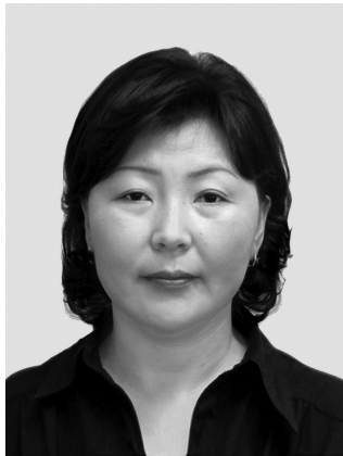
Санхүү, эдийн засгийн дээд сургуулийн Хүмүүнлэгийн ухааны тэнхмийн багш