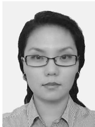
Санхүү, эдийн засгийн дээд сургуулийн Хүмүүнлэгийн ухааны тэнхмийн багш