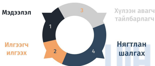
(График №2 Харилцааны чадвар)

Цагдаагийн алба хаагчийн харилцааны соёл: Харилцаа гэдэг нь юуны өмнө санаа бодлого, мэдлэг туршлага, соёлын солилцоо буюу хүмүүсийн хоорондын үйлдлийн тодорхой илрэл юм. Харилцааны соёл нь хүмүүс хоорондын дээр үеэс уламжлагдан ирсэн бие биетэйгээ ойлголцох үндсэн хэрэглэгдэхүүний боловсронгуй хэлбэр болдог ажээ.