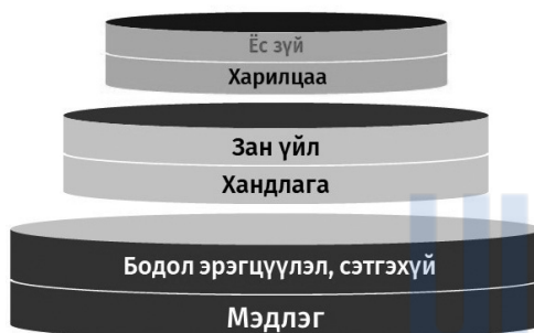
(График 1. Мэргэжлийн ёс зүй бүрэлдэх үе шат)

Доктор С.Наранчимэг Мэргэжлийн ёс зүй бүрэлдэх үе шатыг доорх байдлаар авч үзсэн байна 12 .